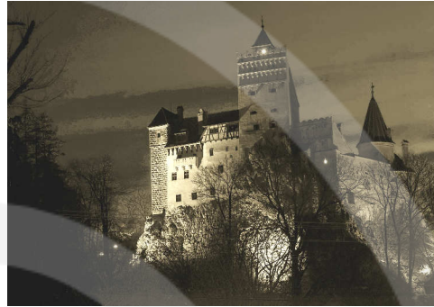
Castle Dracula in Transylvania, Romania